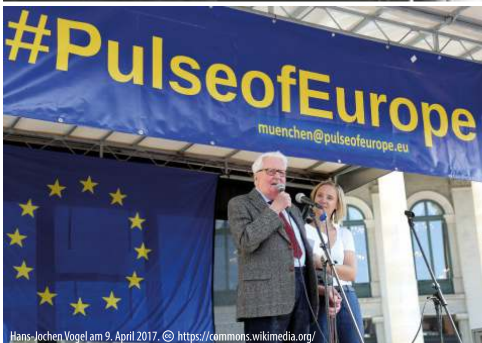
Hans-Jochen Vogel am 9. April 2017.

проведения Олимпиады израильская команда подверглась нападению палестинских террористов. В результате погибли 11 израильтян, взятых в заложники, один немецкий полицейский и всего лишь пять из восьми террористов.