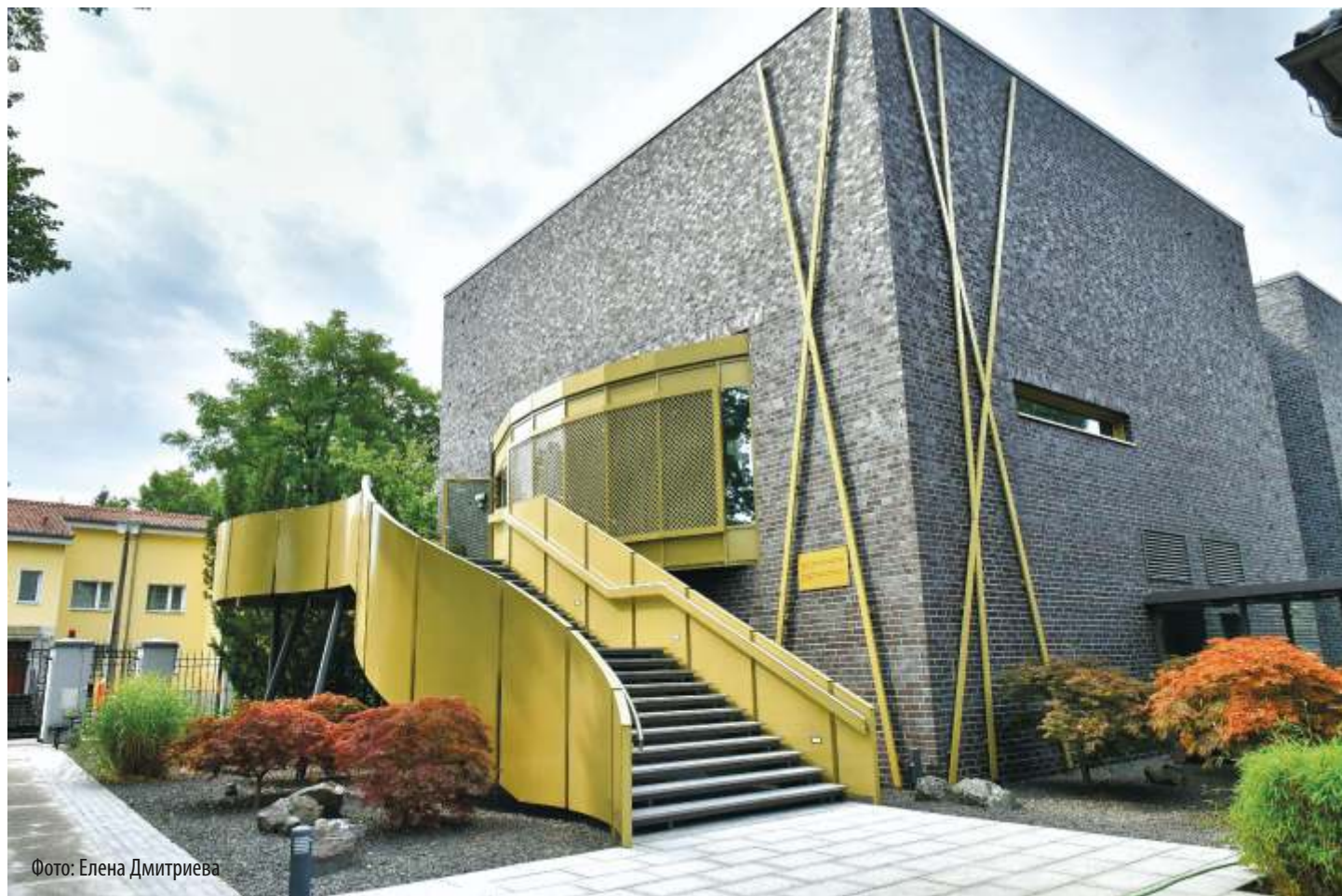
Фото: Елена Дмитриева

Вместе с тем, дальнейшая стабилизация эпидемиологической ситуации даёт надежду, что совсем скоро стороны смогут вернуться к прежнему безвизовому режиму – тем более что, как я