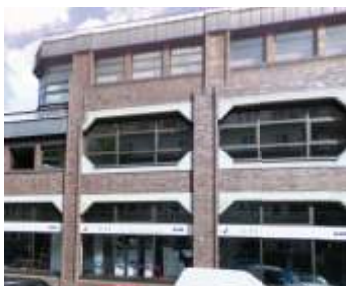
Mindener Str. 20 Düsseldorf-Oberbilk

Дорогие друзья, мы ждем Вас по новым адресам: