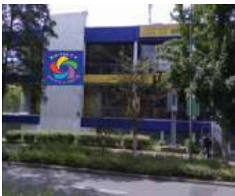
Wilhelm-Kreis-Str. 2 Düsseldorf-Garath