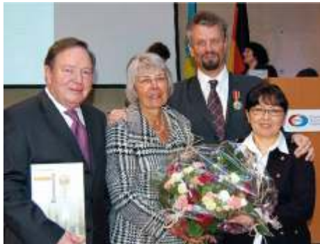
пы «Германия – Центральная Азия».