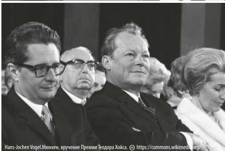
Hans-Jochen Vogel. Мюнхен, вручение Премии Теодора Хойса.