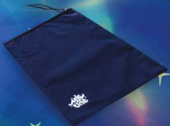
ТЕКСТИЛЬНЫЙ ЧЕХОЛ ТЁМНО-СИНЕГО ЦВЕТА