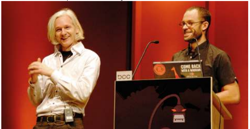
Фото: Andreas Gaufer. https://commons.wikimedia.org

Сайт WikiLeaks был зарегистрирован в 2006 году, и в декабре того же года на этом