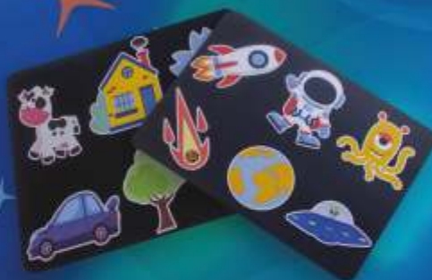
2 ЧЁРНЫХ ТРАФАРЕТА