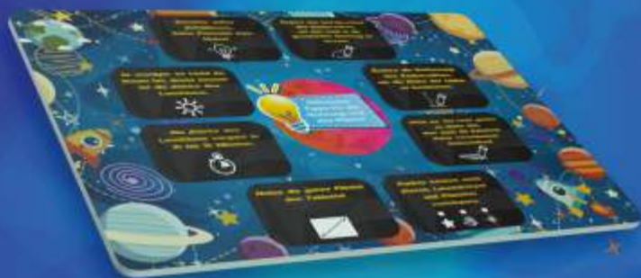
СПЕЦИАЛЬНЫЙ ПЛАНШЕТ ФОРМАТА А4