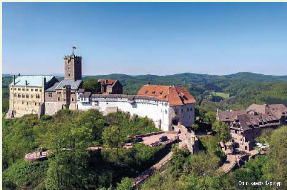
Фото: замок Вартбург