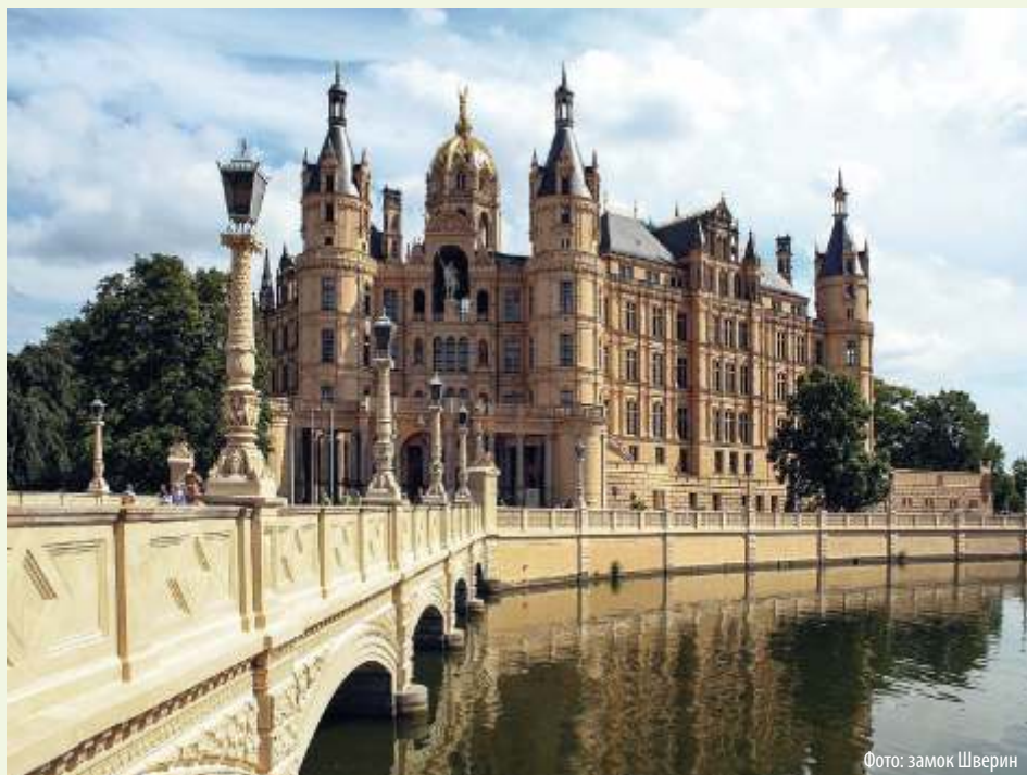
Фото: замок Шверин

Элементы французского Ренессанса в сочетании с местными строительными традициями производят поистине неописуемый эффект на тех, кто видит Шверинский замок впервые. Внутри замка можно побродить по великолепным гостиным и банкетным залам, открыты для себя тронный зал и родовую галерею великих герцогов. На трех этажах посетителей ожидают драгоценные картины, скульптуры и изделия народных промыслов, в особенности относящиеся к самой величественной эпохе Мекленбурга – XIX веку.