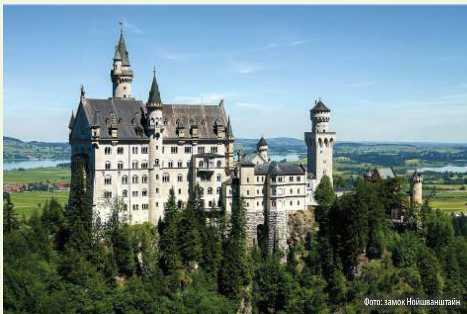
Фото: замок Нойшванштайн

дер Пфальц приказал перестроить и расширить бывший средневековый охотничий замок. До 1778 года он использовался курфюрстом Карлом Теодором в качестве летней резиденции. Дворцовый театр, построенный в 1752 году, является старейшим из сохранившихся театров в Европе. Любопытной особенностью дворца Шветцинген является молниеотвод на его крыше – самая старая из сохранившихся «птичьи звезды Хеммера». Но настоящей изюминкой был и остаётся дворцовый сад площадью почти 70 гектаров.