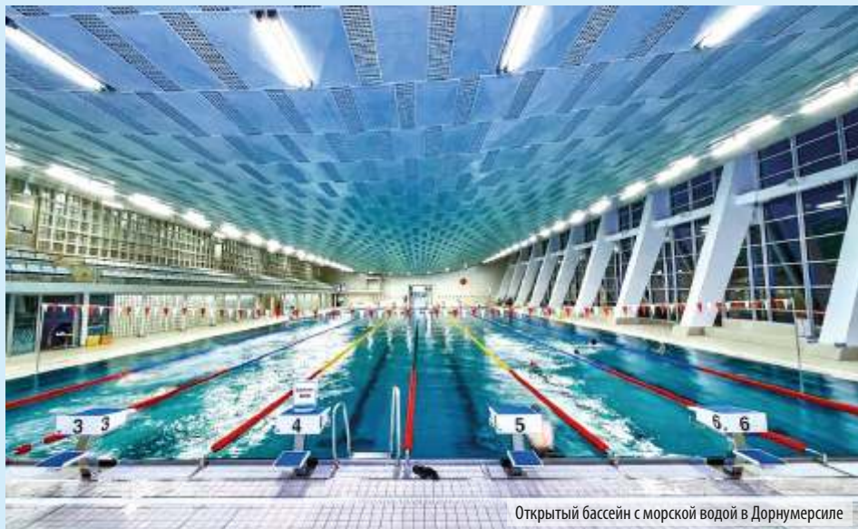
Открытый бассейн с морской водой в Дорнумерсиле

Для того, чтобы это сделать – достаточно отправиться в Naturbad Stadtparksee.