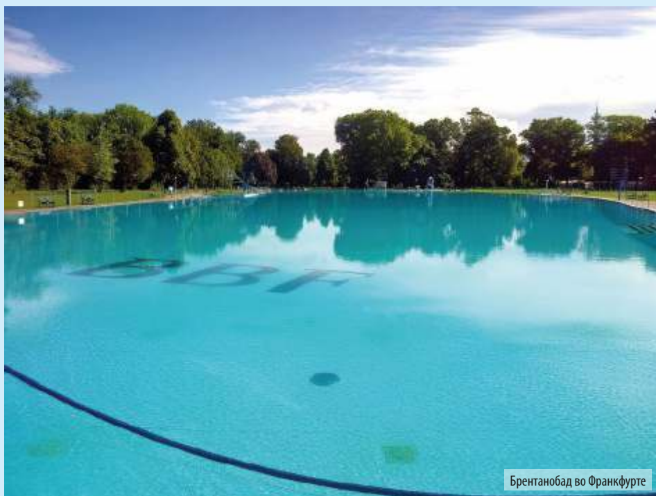
Брентанобад во Франкфурте