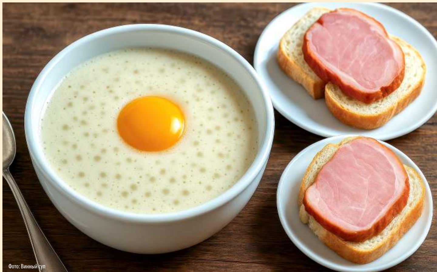
Фото: Винный суп

скатным орехом, размешанный с яичным желтком и поданный с морковью, сельдереем, луком-пореем и корнем петрушки, — этот изысканный суп заслуживает как минимум двух звёзд от кулинарного гида «Мишлен».