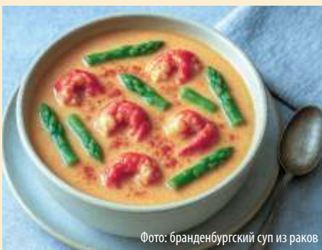
Фото: бранденбургский суп из раков