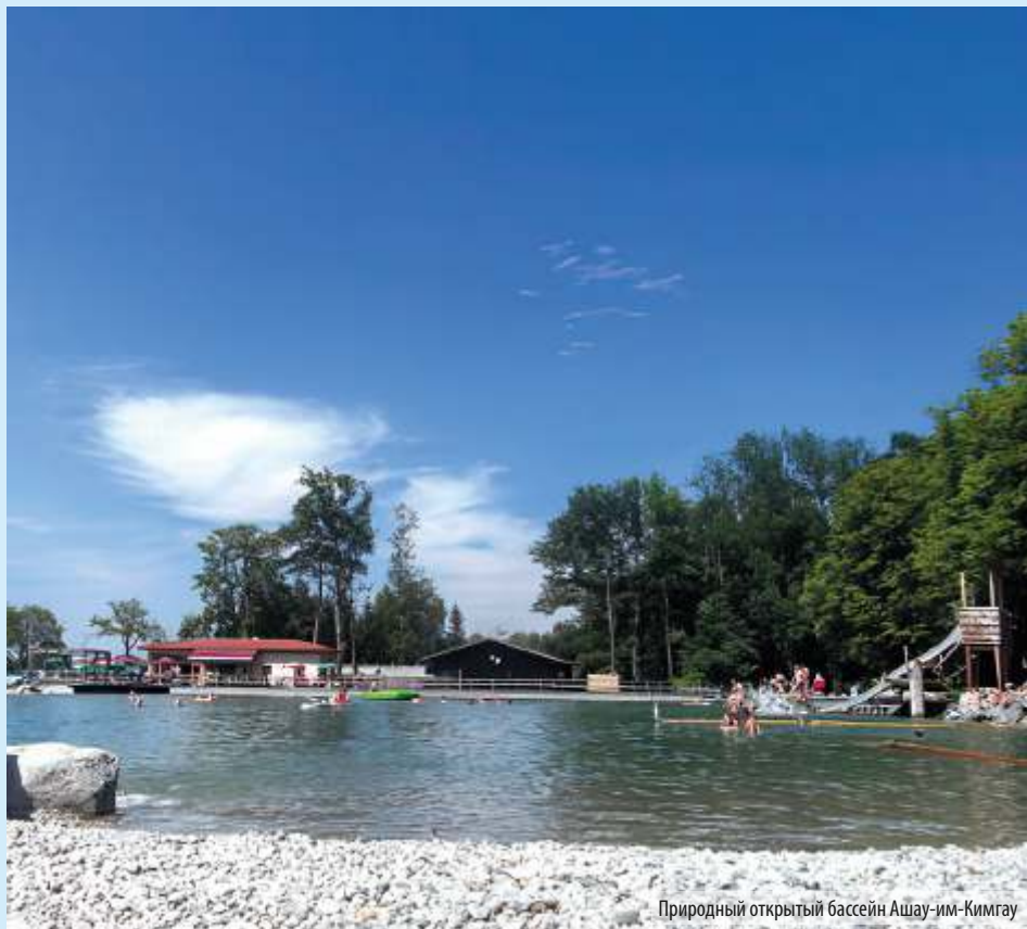
Природный открытый бассейн Ашау-им-Кимгау

Если речь заходит об аквапарках и водных развлечениях, средиземноморские страны вроде Испании, Италии, Греции и Турции обычно находятся в лидирующей