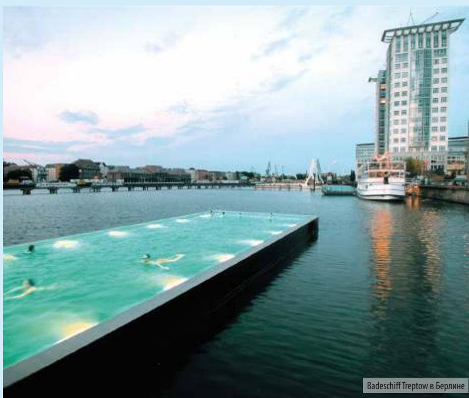
Badeschiff Treptow в Берлине

группе. Однако наши австрийские соседи также сумели создать на удивление крутой аквапарк. В Area 47 посреди бассейна есть трамплин, с которого можно выстрелить собой из водяной пушки в стиле барона Мюнхгаузена!