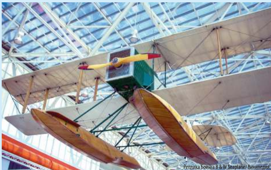
Реплика Боинга B & W Seaplane