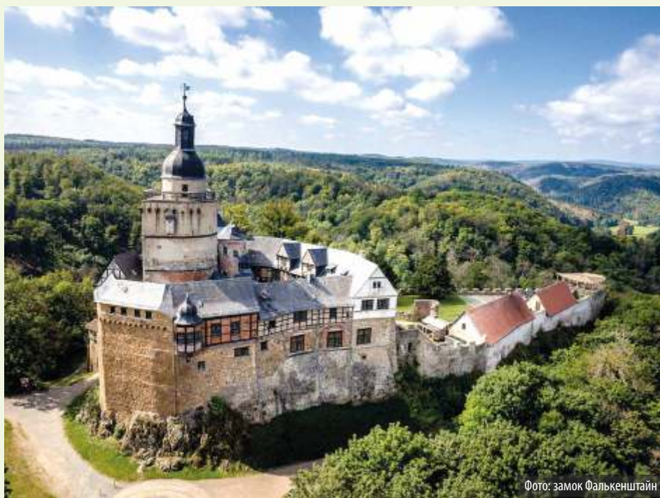
Фото: замок Фалькенштайн

Высоко на горе Фалькенштайн близ Пфронтена на юго-западе Баварии лежат руины одноименного замка: на высоте