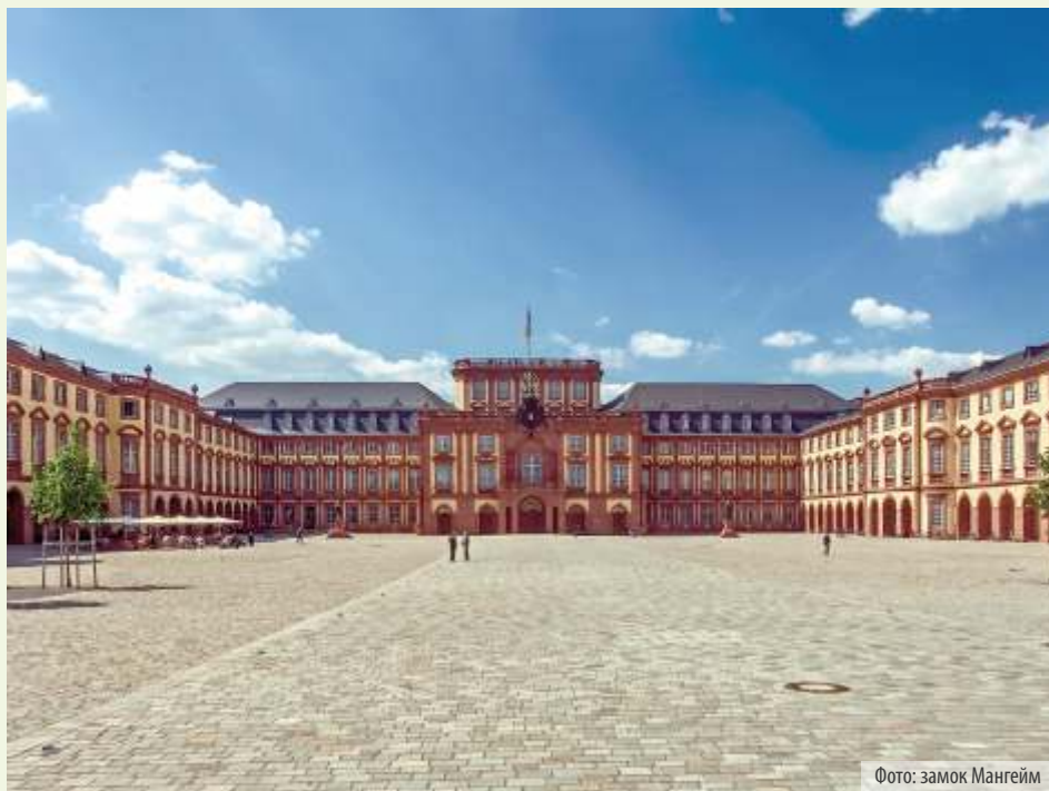
Фото: замок Мангейм