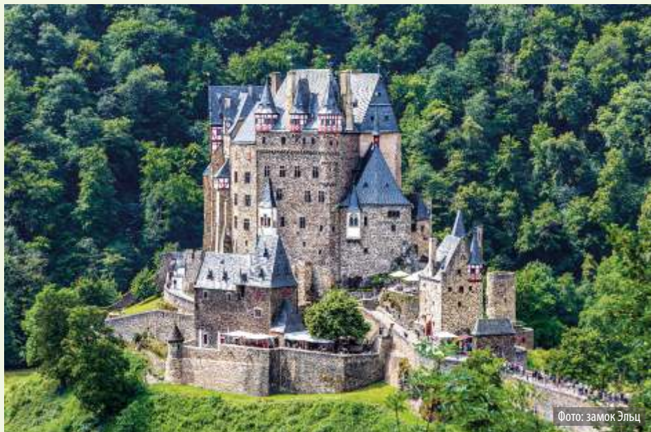
Фото: замок Эльц

Его фахверковая структура и многочисленные башни, ориентали, крыши и шпили делают замок Эльц воплощением средневекового рыцарского замка. В XIX веке он стал местом тоски романтизма: здесь гостили Виктор Гюго и английский художник Уильям Тёрнер, а также император Германии. Бундесбанк также признал его уникальность и напечатал замок Эльц на реверсе третьей серии банкнот номиналом 500 немецких марок. Замок Эльц до сих пор является резиденцией семьи графа фон Эльц. В летние месяцы ворота открыты для посетителей, которые могут принять участие в экскурсиях по отдельным