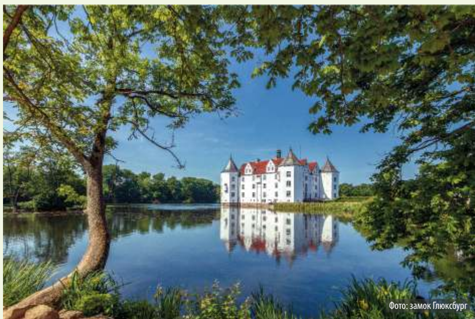
Фото: замок Глюксбург

частям замка и сокровищнице Эльца с более чем 500 экспонатами, собранными за почти девять веков.