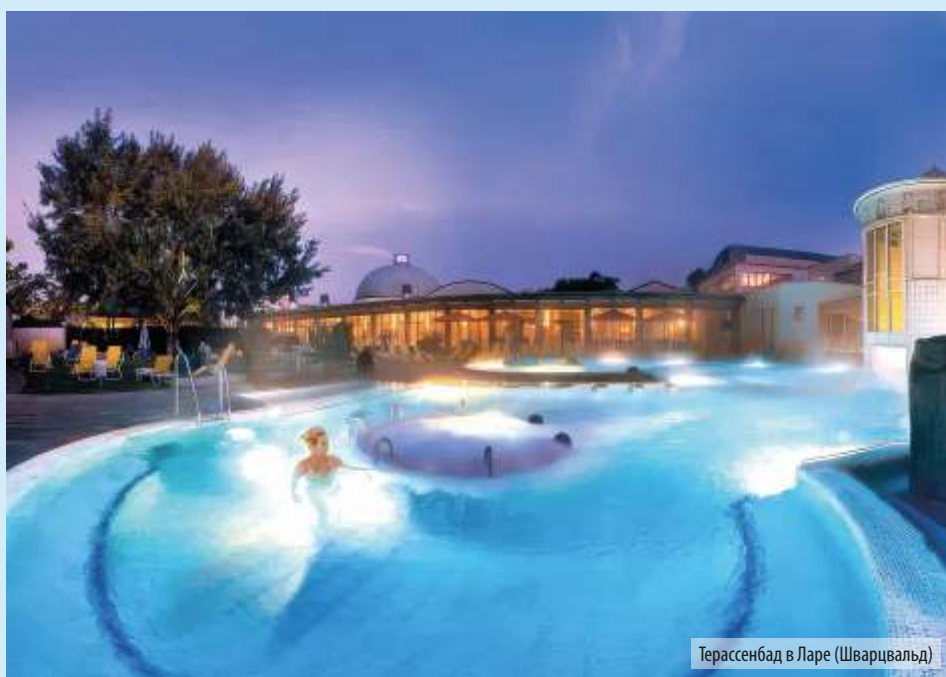
Терассенбад в Ларе (Шварцвальд)