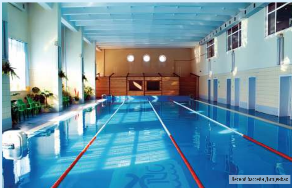
Лесной бассейн Дитценбах