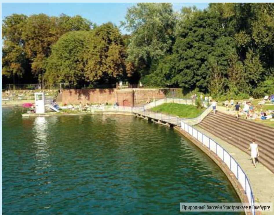
Природный бассейн Stadtparksee в Гамбурге