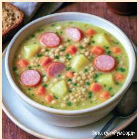
Фото: суп «Румфорд»

Разнообразие ингредиентов, таких как лук-порей, сельдерей, морковь, лук, копчёный бекон, сметана, лавровый лист, тмин, ягоды можжевельника, майоран, му-