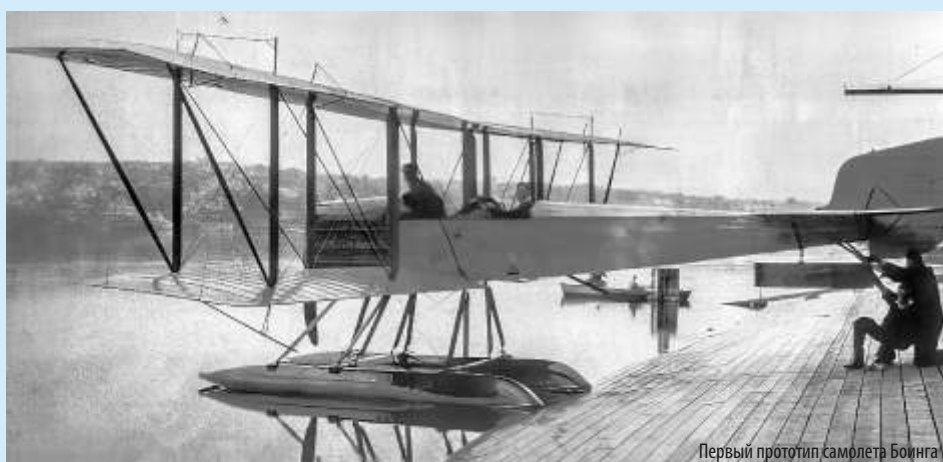
Первый прототип самолета Боинга