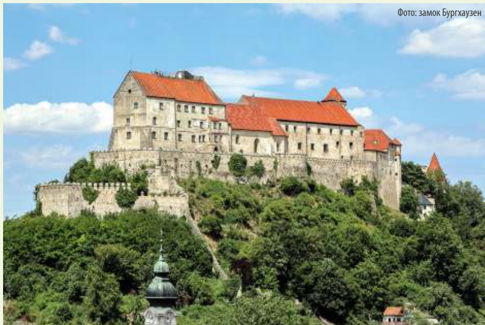
Фото: замок Бургхаузен

Виттельсбахи использовали замок Бургхаузен в качестве второй резиденции до 1505 года. Затем он утратил своё политическое значение и использовался в основном в военных целях. Сегодня огромный комплекс используется по-разному, ведь места здесь предостаточно: часть замка сдаётся в аренду под квартиры или для проведения мероприятий, а в замке Бургхаузен расположено несколько музеев, таких как Государственный музей, Баварская государственная коллекция живописи и музей пыток. С крепостных стен открывается впечатляющий вид на долину реки Зальцах.