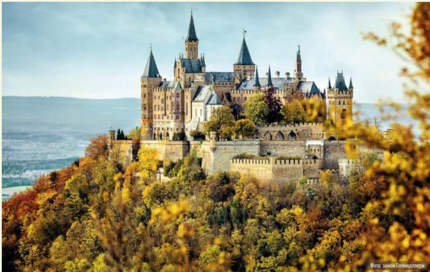
Фото: замок Гогенцоллерн

ля Людвига II Баварского — короля-мечтателя, тонкого ценителя музыки и архитектуры.