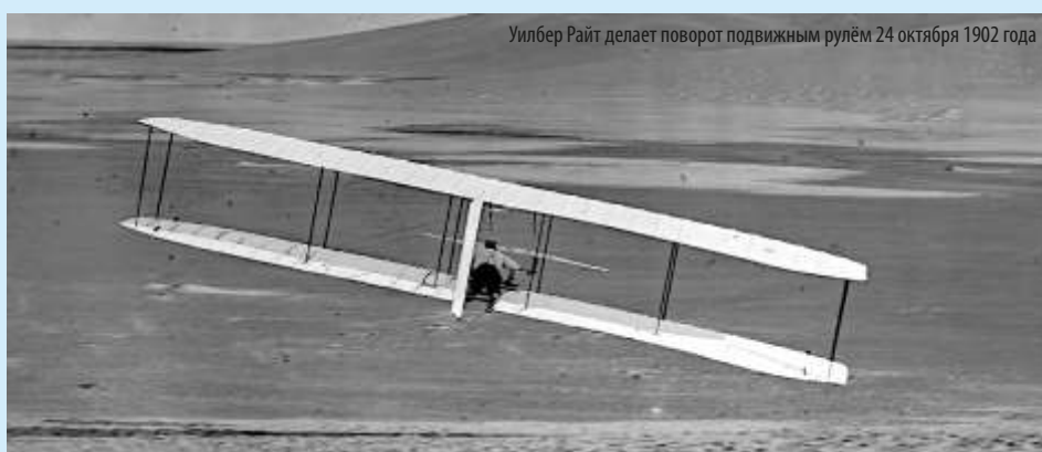
Уилбер Райт делает поворот подвижным рулём 24 октября 1902 года