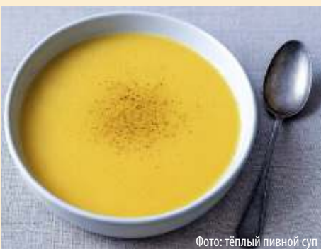
Фото: тёплый пивной суп

скатный цвет, листья петрушки и кервеля, придают берлинскому картофельному супу несравненный аромат.