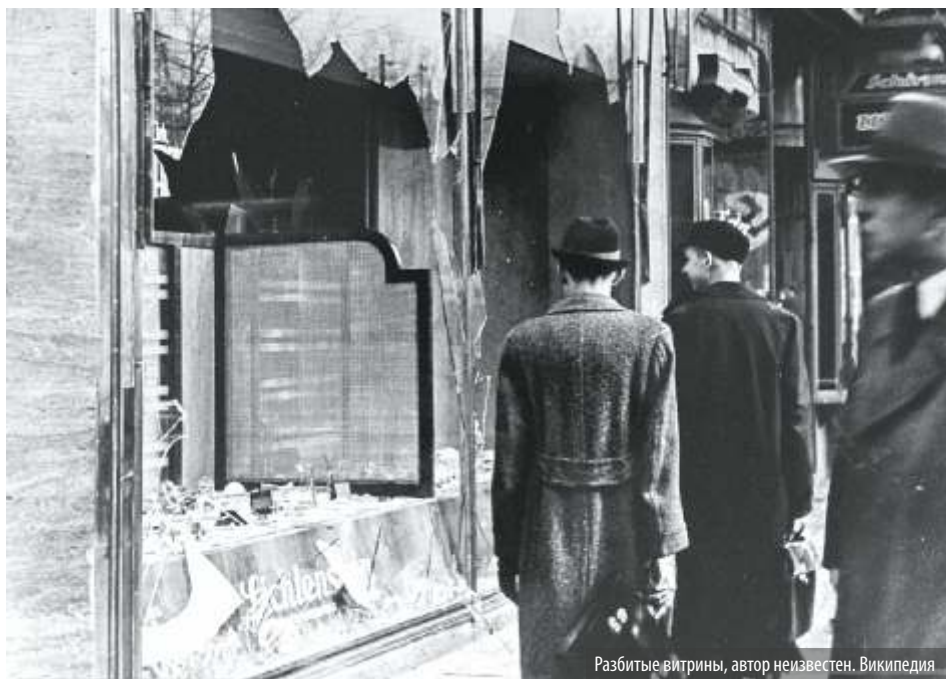
Разбитые витрины