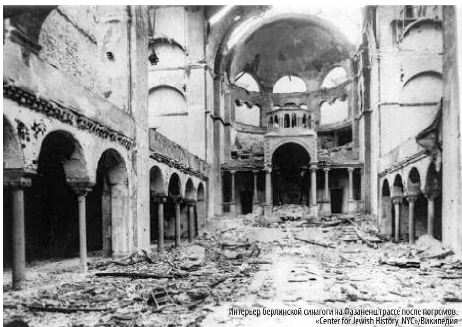
Интерьер берлинской синагоги на Фазаненштрассе после погромов.