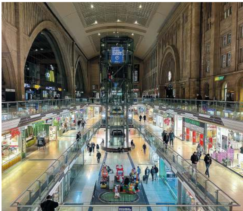
Центральный вокзал Лейпцига