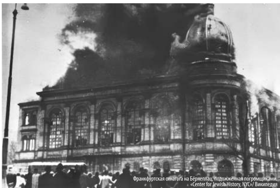
Франкфуртская синагога на Бёрнеплатц, подожжённая погромщиками.